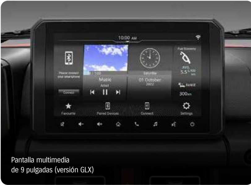
Pantalla multimedia de 9 pulgadas (versión GLX)